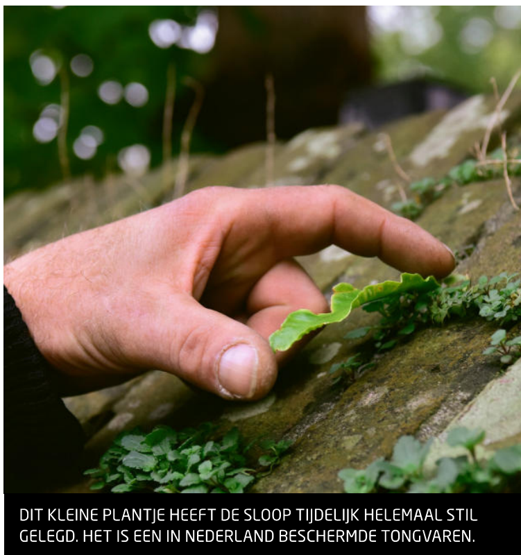
DIT KLEINE PLANTJE HEEFT DE SLOOP TIJDELIJK HELEMAAL STIL GELEGD. HET IS EEN IN NEDERLAND BESCHERMDE TONGVAREN.

deurtjes in de muren en overwinteringsbakken in de bomen en overige gebouwen lokken we de vlemuizen telkens uit het gebouw dat gesloopt gaat worden', legt De Vries uit.