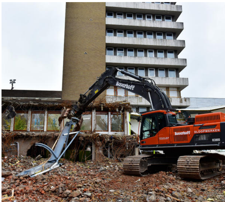
DE ENTREE VAN HET HOOFDGEBOUW - WAAR DE VRIES JAREN GELEDEN HOORDE DAT ZIJN SCHOONMOEDER ONGENEESLIJK ZIEK WAS - IS HALF AFGEBROKEN. GEVELS, FUNDERINGEN EN OPERATIEKAMERS ZIJN TOT PUIN VERPULVERD.